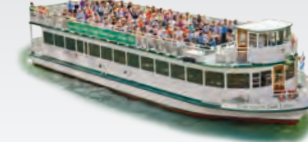
CHICAGO'S FAIR LADY