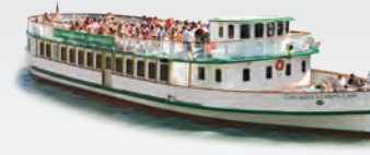
CHICAGO'S LEADING LADY