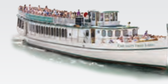
CHICAGO'S FIRST LADY