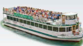
CHICAGO'S FAIR LADY