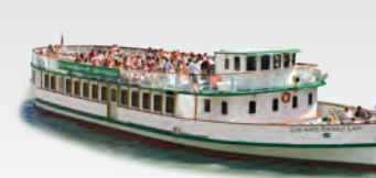
CHICAGO'S EMERALD LADY