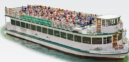
CHICAGO'S FAIR LADY