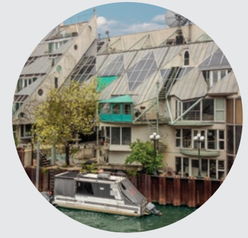
HARRY WEESE COTTAGES