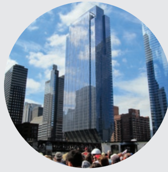
150 NORTH RIVERSIDE