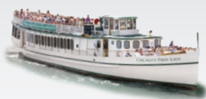
CHICAGO'S FIRST LADY